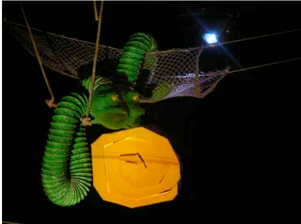
Le lion débordé par l'émotion ...

Les animaux sont réalisés en carton, en tuyau de plastique, en mousse et sont plutôt des objets animés.